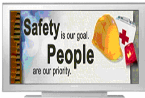
Einsatzbeispiel im Bereich Mitarbeiterkommunikation